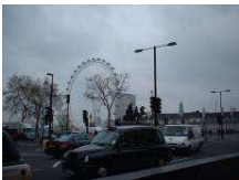
London Eye maailmanpyörä